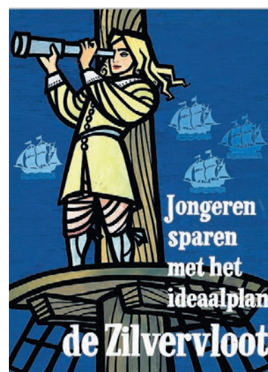
Reclame voor de oude Zilvervlootregeling Affiche ReclameArsenaal

De regeling was een groot succes. Honderdduizenden kinderen maakten er in de loop der jaren gebruik van. Totdat er in 1992 een eind aan kwam. De toenmalige regering zag geen reden voor dergelijke paternalistische spaarbeloningen. Bovendien kon de schatkist de tientallen miljoenen die de Zilvervloot de staat